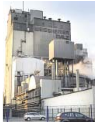
Gerettet: die Mälzerei von Weissheimer.

Im Revierpark Nienhausen präsentieren Händler aus Deutschland und Holland zum nunmehr dritten Male ihre Stoffe. Der Markt ist am morgigen Sonntag, 21. Mai, von 11 bis 18 Uhr geöffnet. Frühjahrsstoffe in modischen Farben bestimmen das Bild ebenso wie klassische Möbel und Gardinstoffe. Außerdem können sich die Gäste mit Nähmaschinen und Kurzwaren vertraut machen.