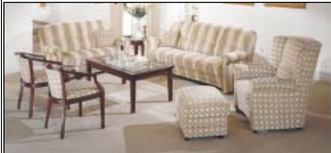
Sitzen Sie bequem und entlasten Sie Ihren Rücken! Echte orthopädische Mohair-Garnituren finden Sie bei Uni-Polster.

ni zahlt bis 333.- € für Ihre Gebrauchte*