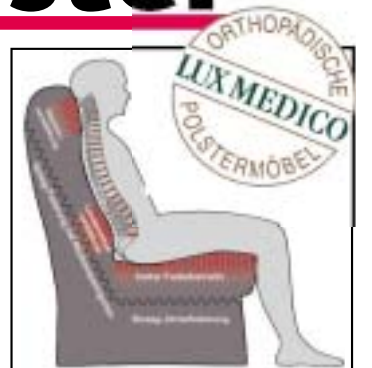
Sitzkomfort kombiniert mit körpergerechter Sitzposition: Orthopädische Möbel bei Uni-Polster.

sche Polstermöbel. Sie finden bei Uni-Polster: Speziell nach wissenschaftlichen Erkenntnissen der Orthopädie und Ergonomie entwickelte Polsterprogramme. Individuelle Modelltypen unterstützen eine körpergerechte Sitzposition und entlasten Wirbelsäule und Muskulatur.