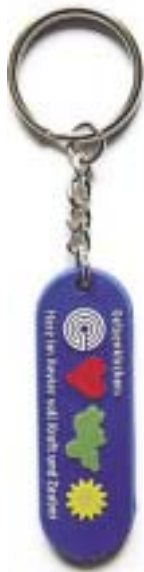
Der Anhänger zum Schlüssel

Die Stadt, sie wirbt. Mit Schmuck und Beiwerk. Mit Nützlichem und weniger Nützlichem, aber immer hübsch mit der Farbe Blau und dem vierfarbigen Logo. Und weil bald WM ist, gibt's derzeit exklusiv im „Stadt-Shop“ auch Taschen, Rucksack oder Um-