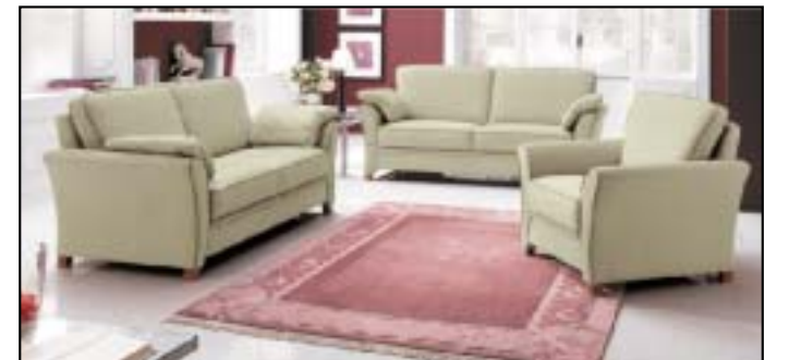
Uni-Polster bietet eine große Auswahl an umfangreichen Systemprogrammen, hier z.B. Modell SALZBURG aus der „Classic Line“.

Nicht nur zur Fußball-WM sollten Sie gesund und bequem sitzen. Machen Sie noch heute die Sitzprobe. Natürlich bei Uni-Polster.