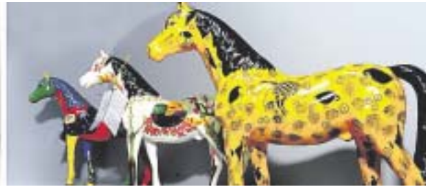
Im Regal der Stadt-Info liegen unter anderem WM-Taschen, GE-Kappen (mit dem floppenden WM-Maskottchen Goleo) und die „aufGEzäumt“-Kunstpferde.